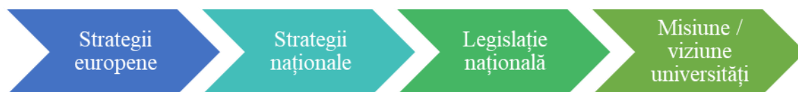
Figura 2.2. Fluxul armonizării reglementărilor din domeniul educației